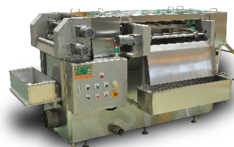
YZG-200型油渣连续过滤机